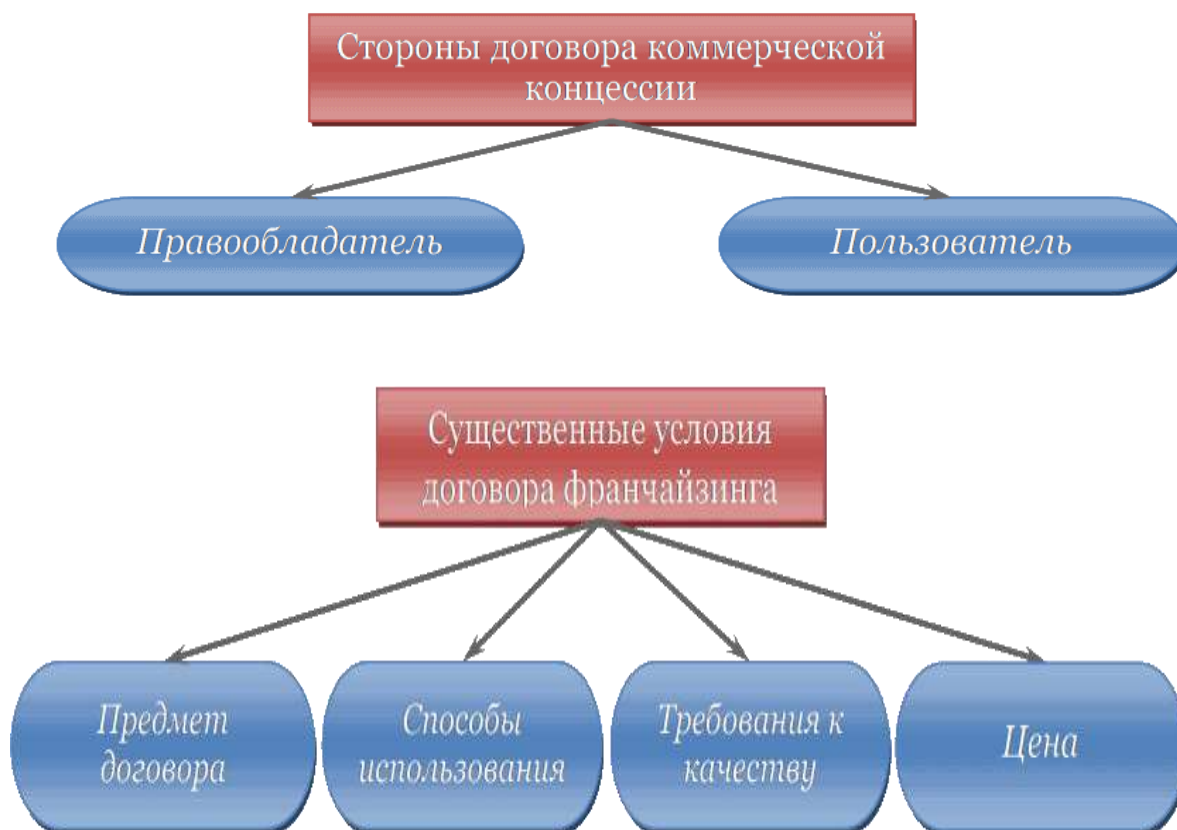
Рисунок 3 – Содержание договора коммерческой концессии

Нумерация листов курсовой работы должна быть сквозной для текста и приложений, начиная с титульного листа. Проставляется нумерация с четвертого листа (титульный лист и задание не нумеруются). Номер листа проставляется справа внизу шрифтом Times New Roman. За листами задания помещается «ОГЛАВЛЕНИЕ», в которое вносят номера и наименования разделов и подразделов с указанием соответствующих страниц, список использованных источников, перечень приложений и другой документации, относящейся к курсовой работе.