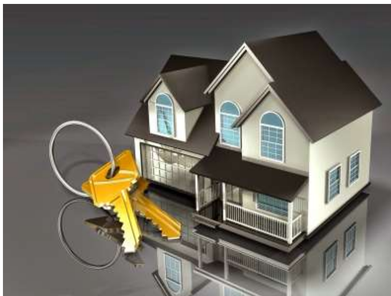
Рисунок 1 – Недвижимое имущество, как объект гражданского права